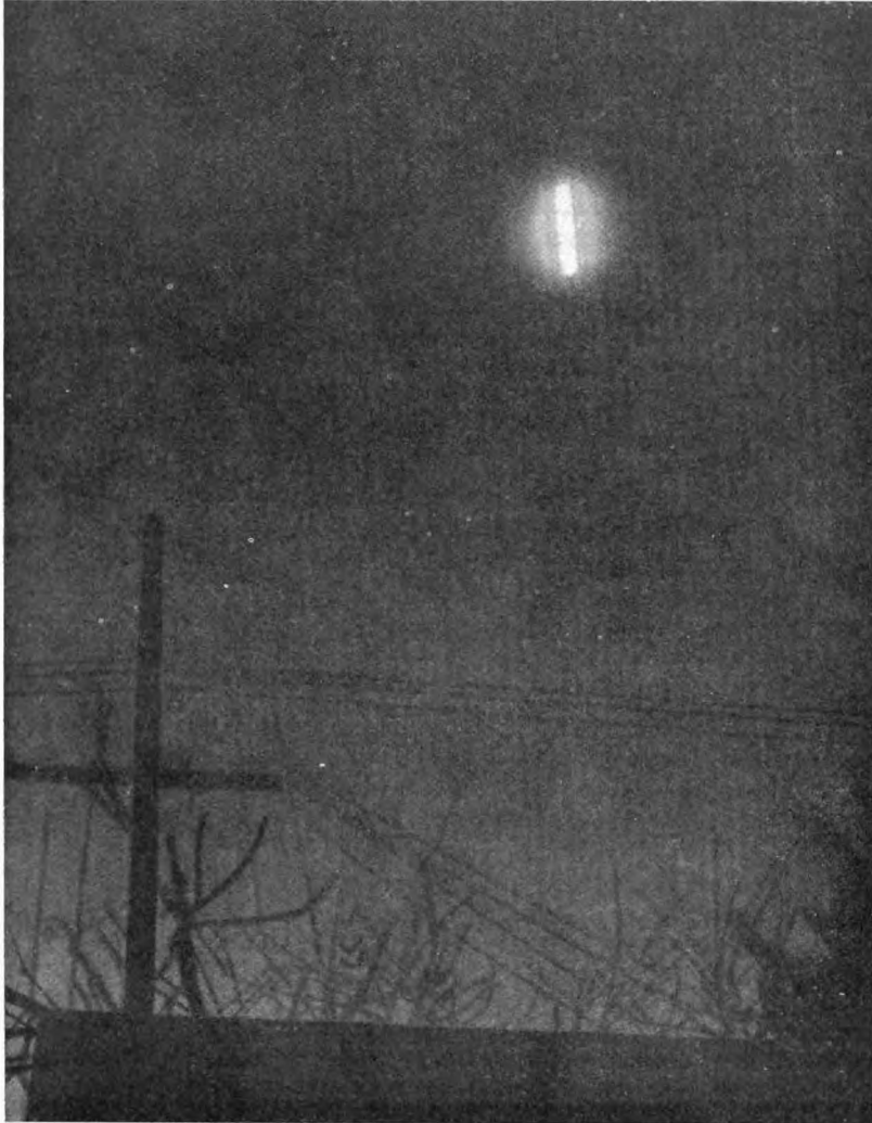
Röhrenförmiges Raumschiff über Los Angeles (s. 3. Umschlagseite)