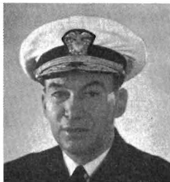
Vice-Admiral Roscoe Hillenkoetter

Pastor der protestantischen Robbins-Memorial Congregational Church in Greenfield, Mass., und Autor mehrerer Bücher mit Millionenaufage.