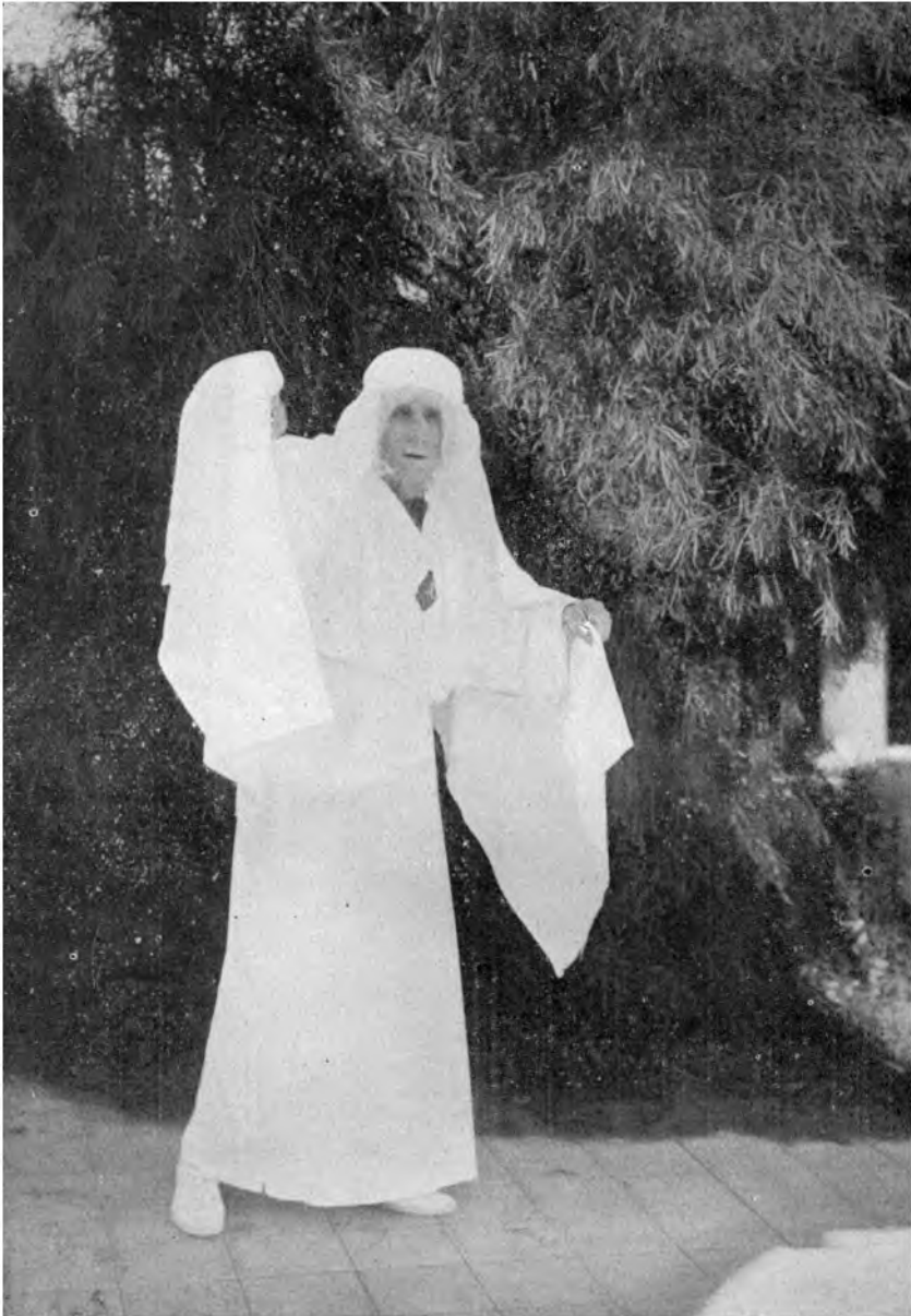
AUS DER EUMENIDEN-AUFFÜHRUNG IM GRIECHISCHEN FREILICHT-THEATER ZU POINT LOMA Der Geist Clytemnestras