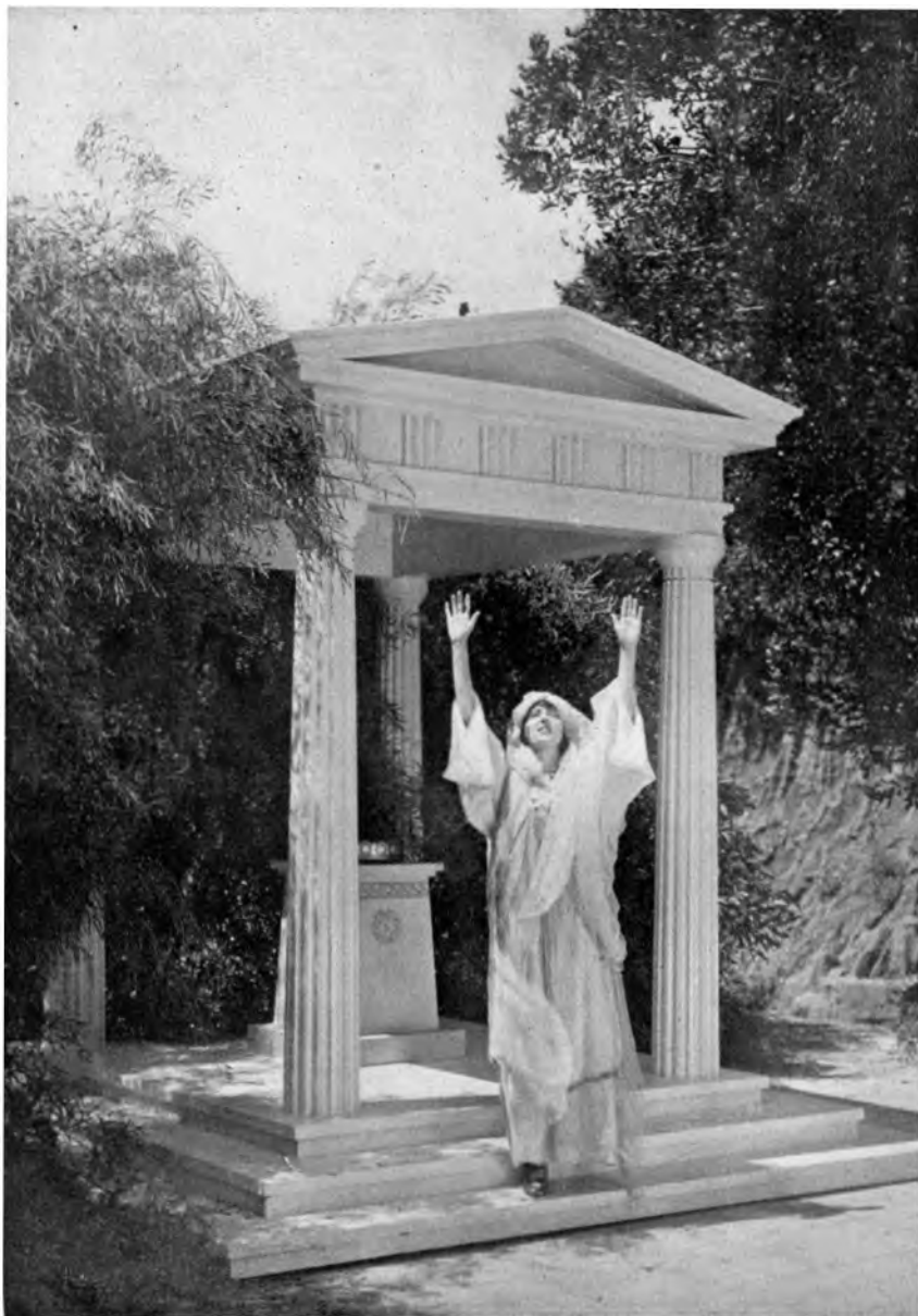
AUS DER EUMENIDEN-AUFFÜHRUNG IM GRIECHISCHEN FREILICHT-THEATER ZU POINT LOMA Die Pythische Prophetin