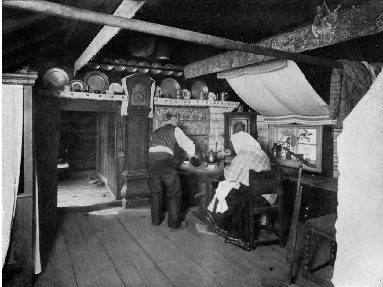
ALTE BLEKINGER-STUBE, SCHWEDEN