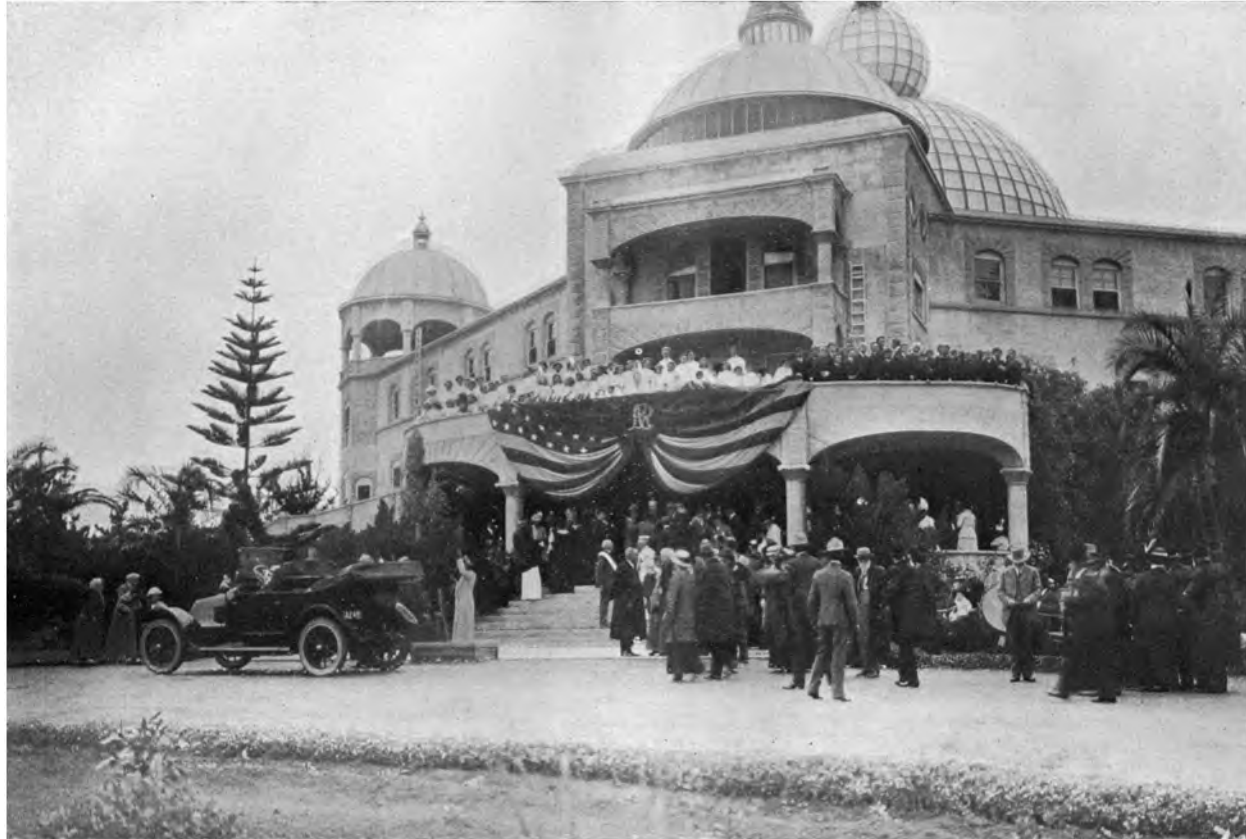
GÄSTE-BEGRÜSSUNG VOR DER RAJA YOGA-AKADEMIE ZU POINT LOMA INTERNATIONALES THEOSOPHISCHES HAUPTQUARTIER, POINT LOMA, CALIFORNIEN