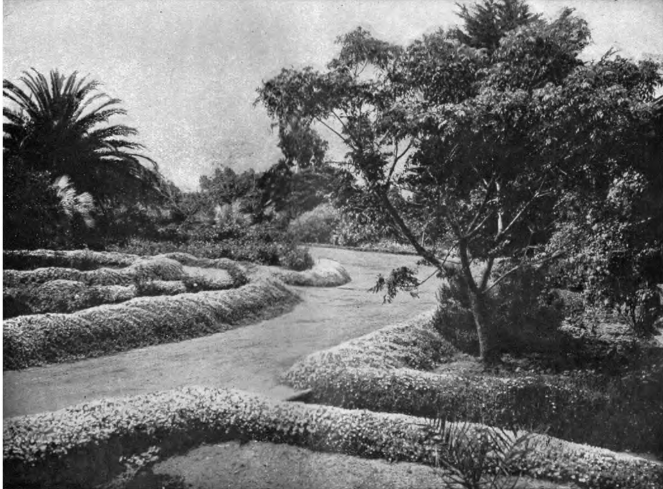
EINER DER STILLEN SPAZIERWEGE AM INTERNATIONALEN THEOSOPHISCHEN HAUPTQUARTIER ZU POINT LOMA, KALIFORNIEN