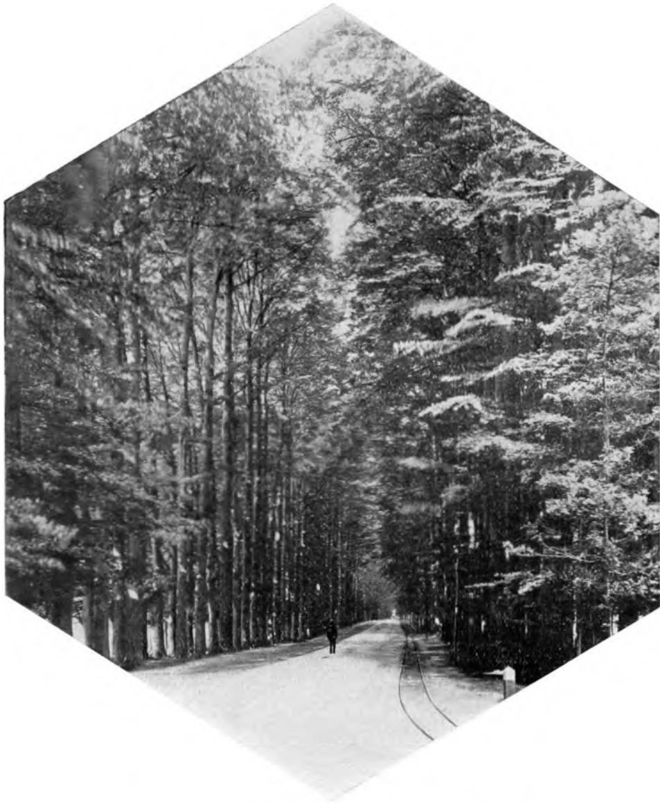
MIDDACTER-ALLEE ARNHEIM, HOLLAND