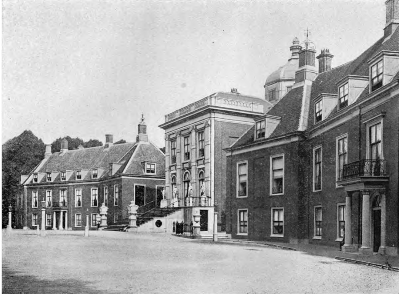
DAS KÖNIGLICHE LUSTSCHLOSS 'T HUIS TEN BOSCH, HAAG, HOLLAND