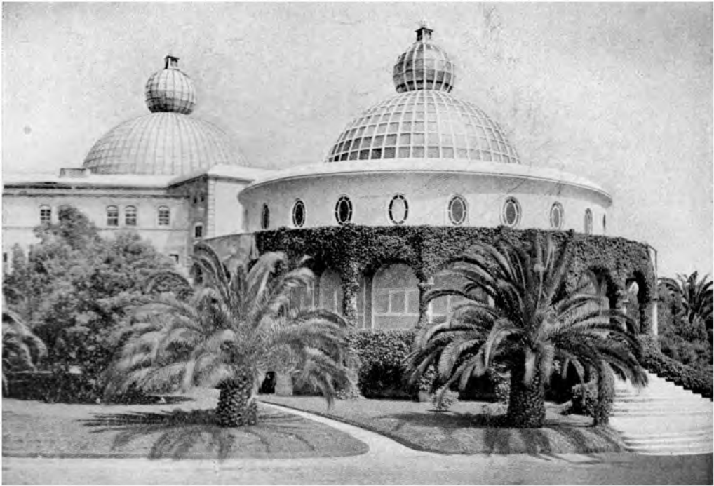
DER TEMPEL DES FRIEDENS ZU POINT LOMA