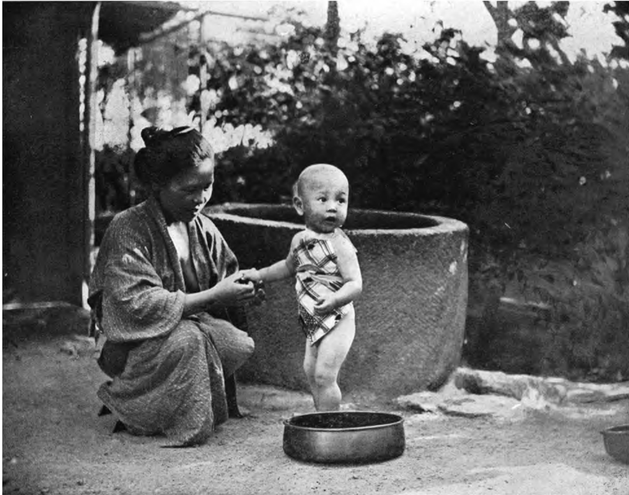
MUTTERS LIEBLING — JAPANISCHES IDYLL