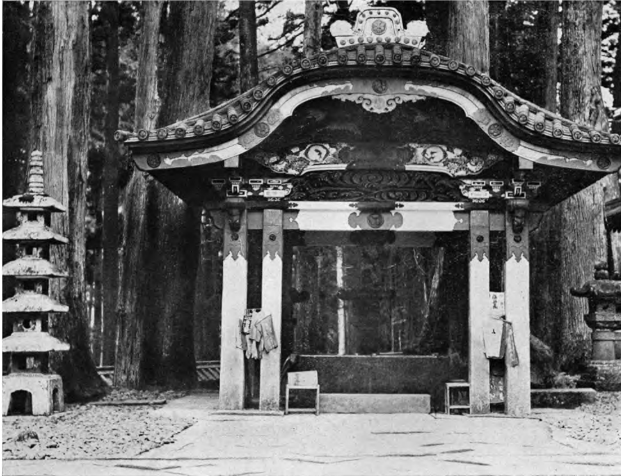
JAPANISCHER TEMPEL ZU NIKKO