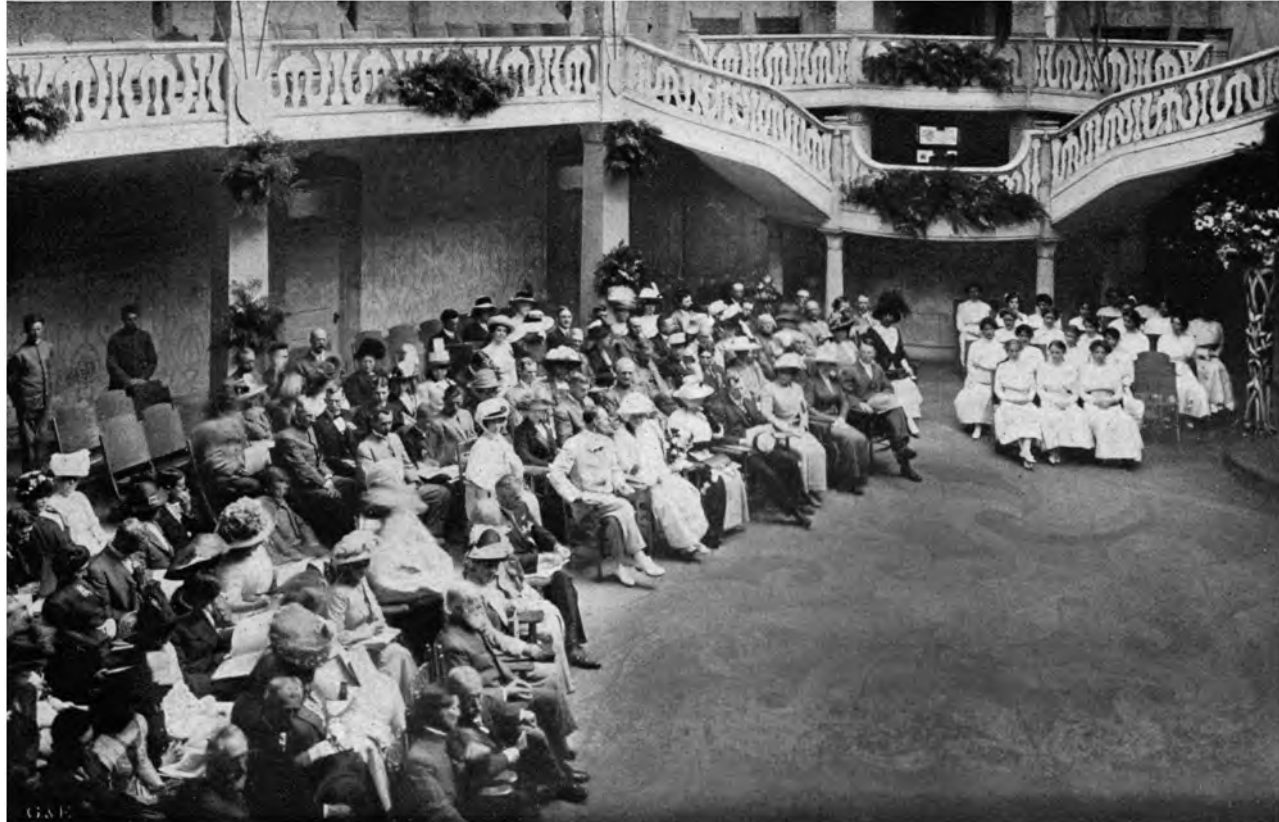
MITGLIEDER DER SÜDKALIFORNISCHEN VERLEGER-VEREINIGUNG bei einem Unterhaltungsabend in der Rotunde der Raja Yoga-Akademie INTERNATIONALES THEOSOPHISCHES HAUPTQUARTIER, POINT LOMA, CALIFORNIEN