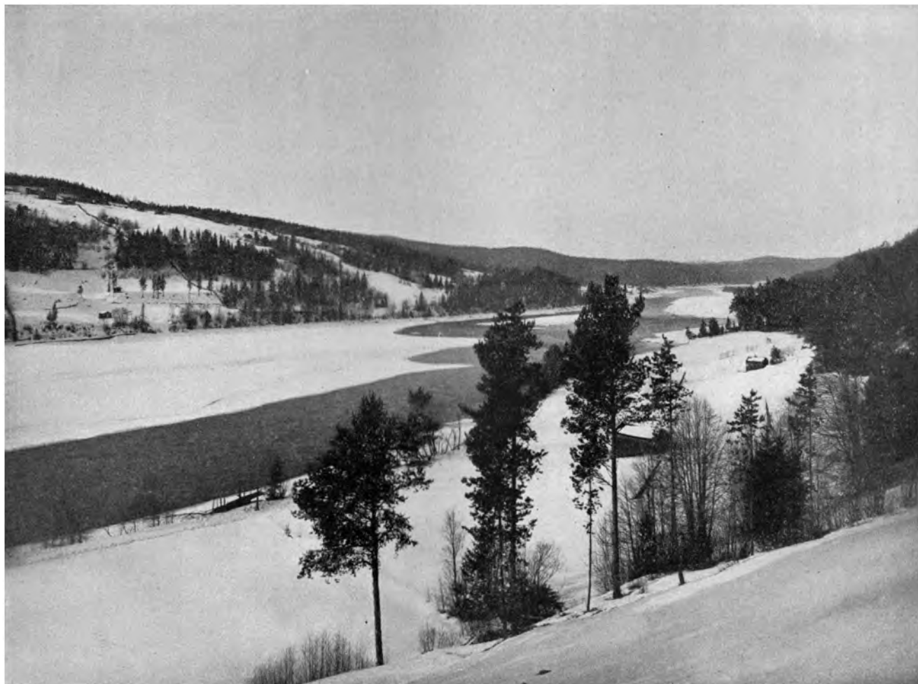
INDALS FLUSS BEI BISP GARDEN, SCHWEDEN