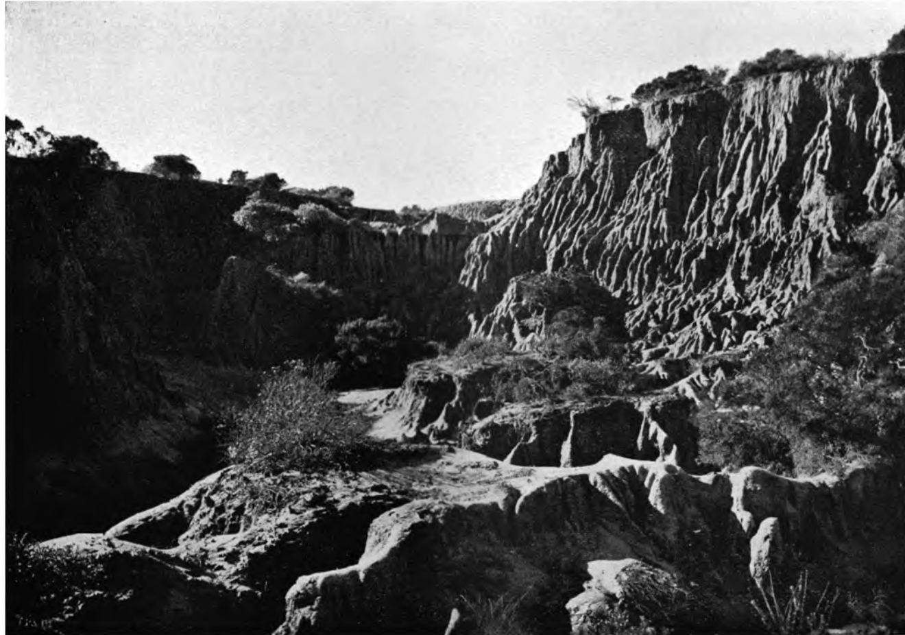
LICHT- UND SCHATTENSPIEL IN DEN FELSGEBILDEN ZU POINT LOMA