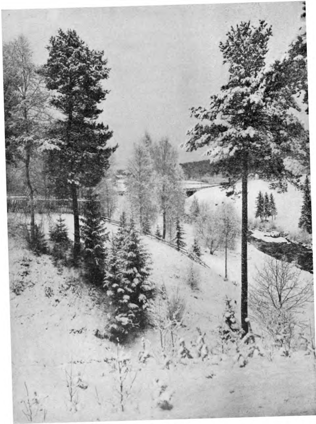
WINTERBILD AUS BISPGÅRDEN, JÄMTLAND, SCHWEDEN