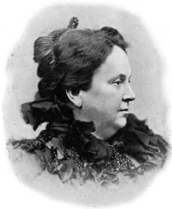
KATHERINE TINGLEY OFFIZIELLES HAUPT UND LEITERIN DER THEOSOPHISCHEN BEWEGUNG DER GANZEN WELT