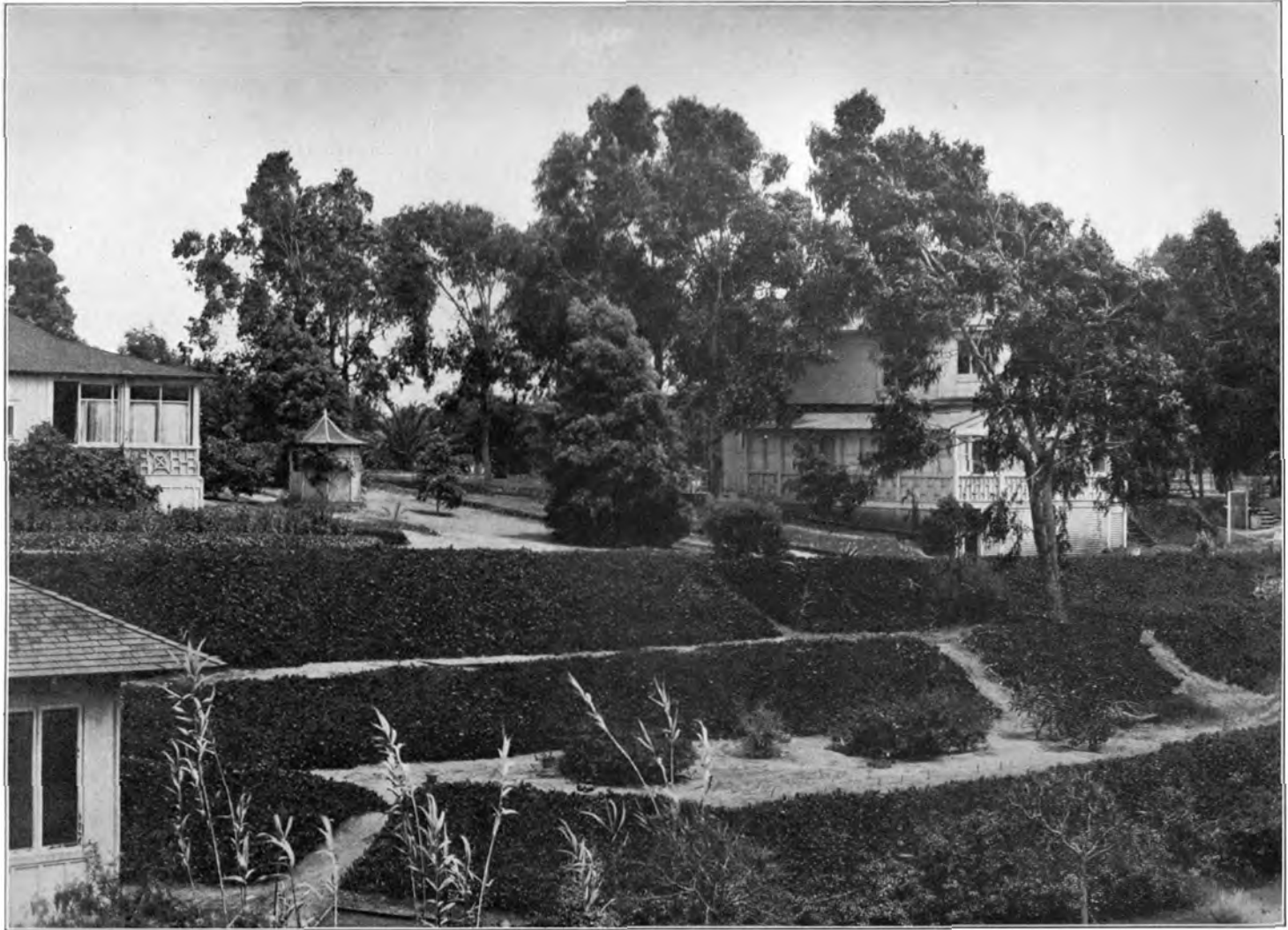
SCHÜLER-HEIME ZU POINT LOMA