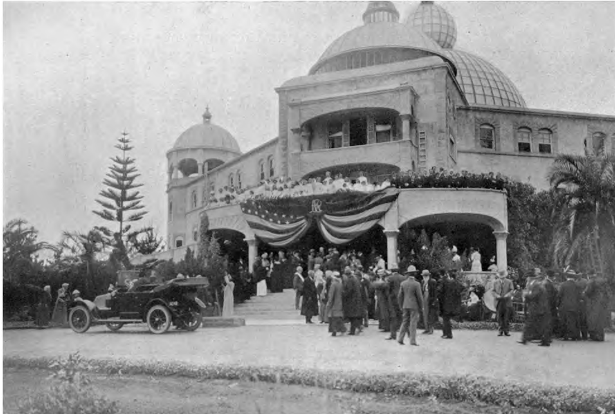
WILLKOMMENGRUSS VON SEITEN DER RAJA YOGA-SCHÜLER AUF DER VERANDA DER RAJA YOGA-AKADEMIE ZU POINT LOMA