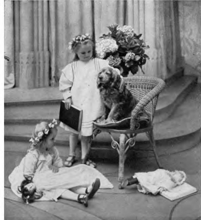
BILDER AUS DEM LEBEN ZU POINT' LOMA INTERNATIONALES THEOSOPHISCHES HAUPTQUARTIER. POINT LOMA, CALIFORNIEN