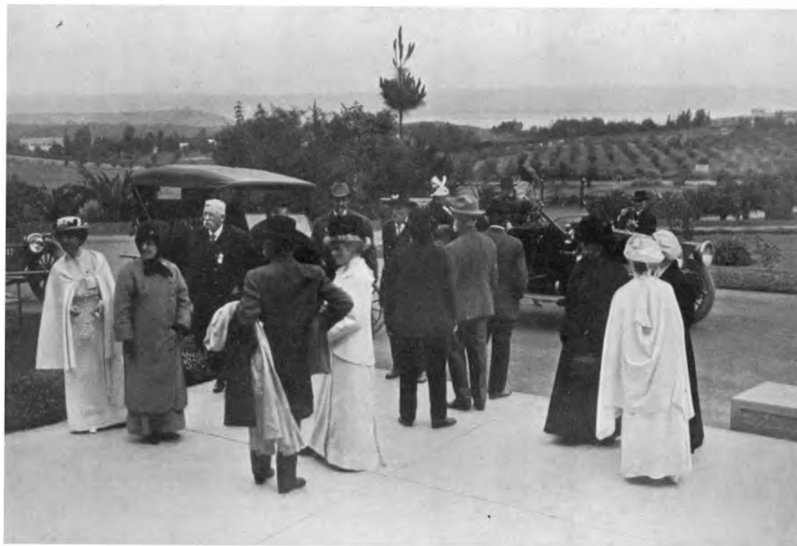
EMPFANG AMERIKANISCHER VETERANEN AM INTERNATIONALEN THEOSOPHISCHEN HAUPTQUARTIER ZU POINT LOMA. ANKUNFT DER GÄSTE