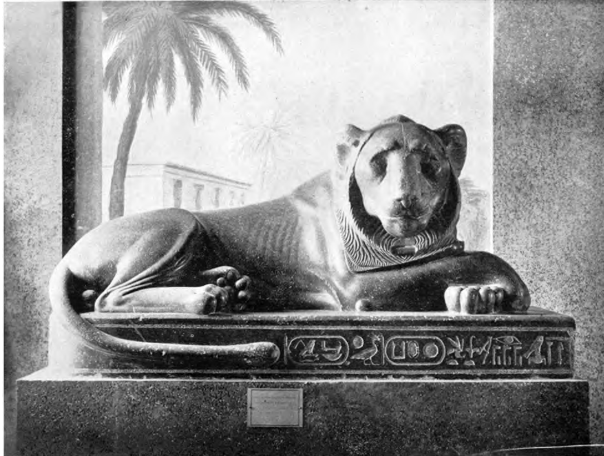
EGYPTISCHER GRANIT-LÖWE IM VATIKAN-MUSEUM