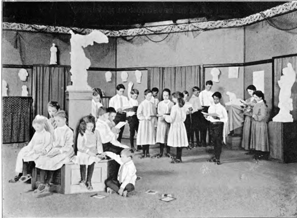
EINE MUSESTUNDE IN DER KUNSTSCHULE ZU POINT LOMA INTERNATIONALES THEOSOPHISCHES HAUPTQUARTIER POINT LOMA CALIFORNIEN