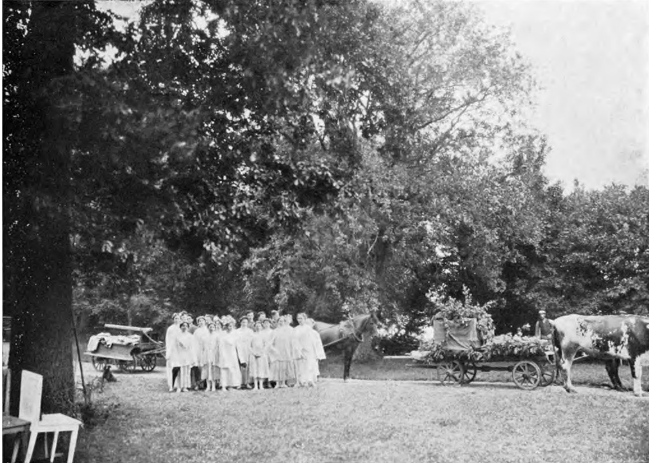
ÜBERFÜHRUNG DES GRUNDSTEINS DER RAJA YOGA-HOCHSCHULE ZU VISINGSÖ, SCHWEDEN, ZU SEINEM BESTIMMUNGSTORT UNTER DEM GESANG DER RAJA YOGA-STUDENTEN