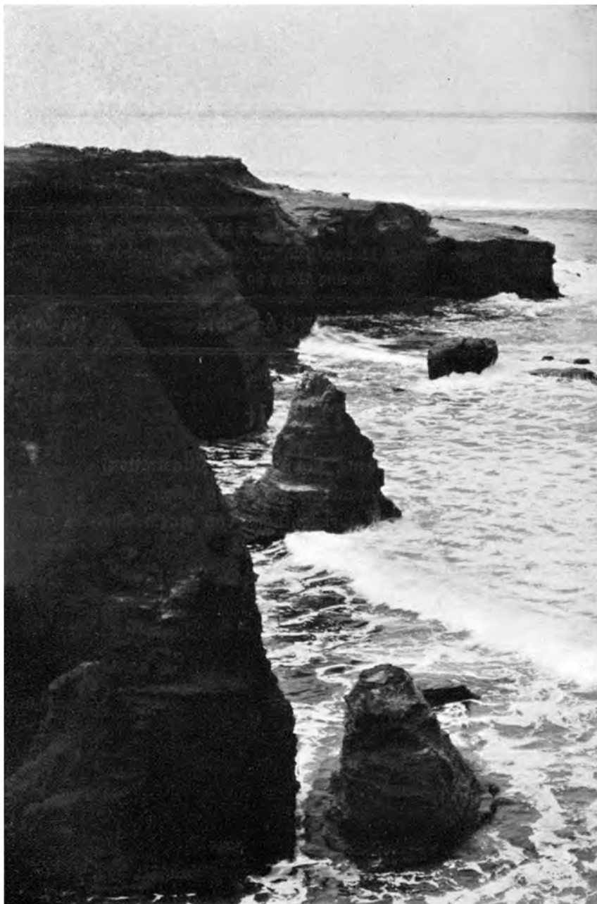
AN DER KÜSTE DES STILLEN OZEANS ZU POINT LOMA, KALIFORNIEN