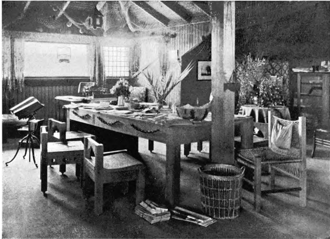
INNENRAUM IM NORDHAUS ZU POINT LOMA