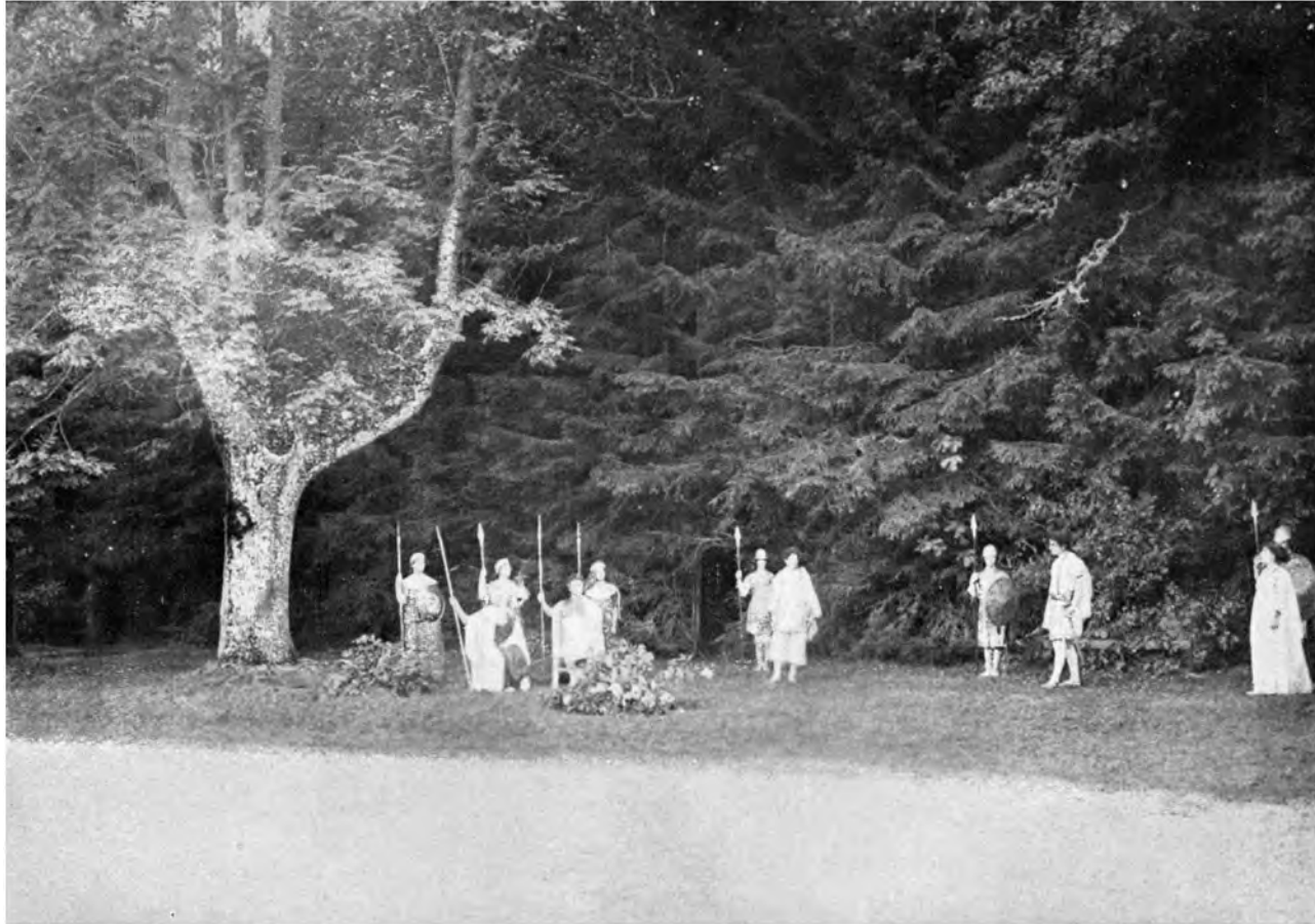
RAJA YOGA-STUDENTEN IN EINER SZENE AUS DEM »SOMMERNACHTSTRAUM« ZU VISINGSÖ, SCHWEDEN, 1913