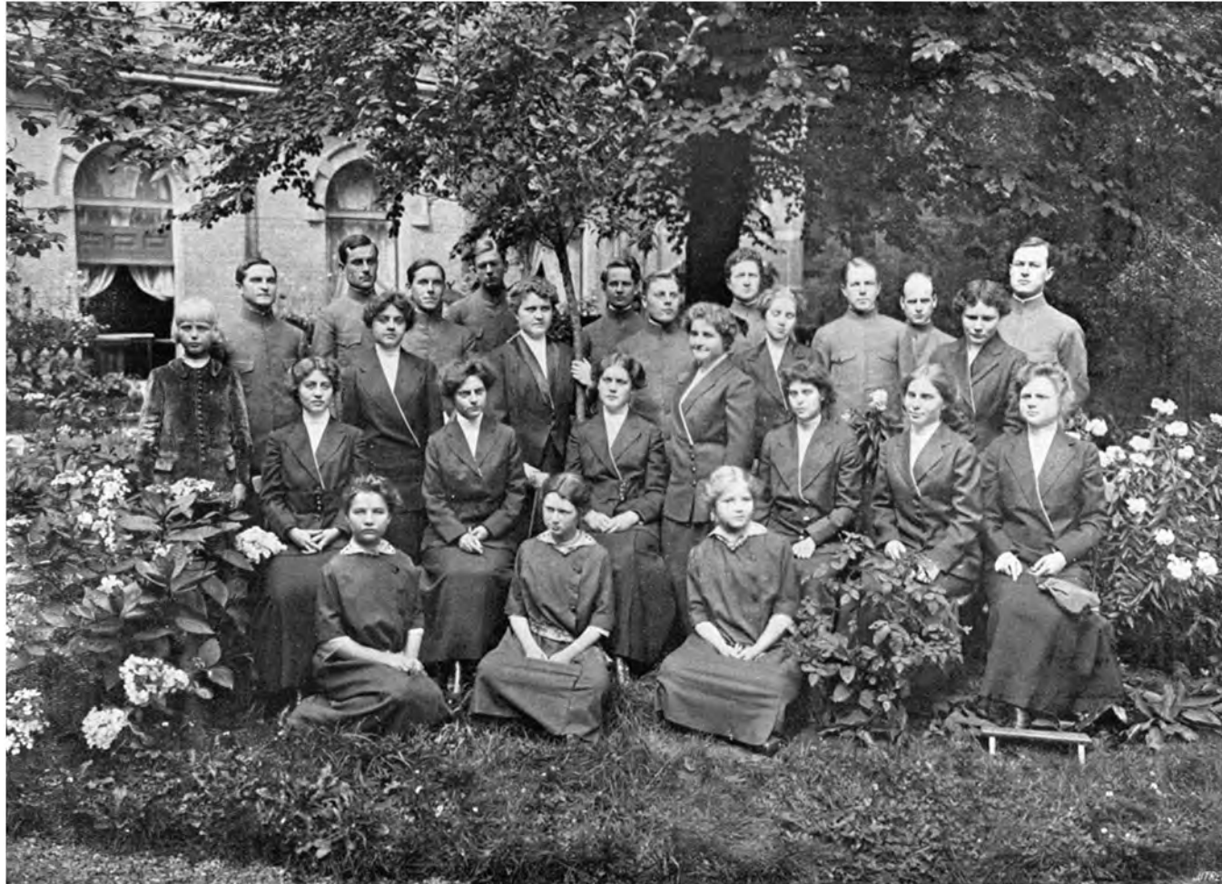
DIE RAJA YOGAS AUS POINT LOMA IM GARTEN DES HOTELS DES PAYS-BAS IN ARNHEIM