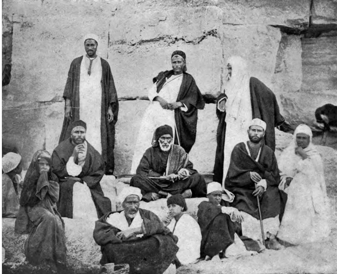
EINE GRUPPE BEDUINEN