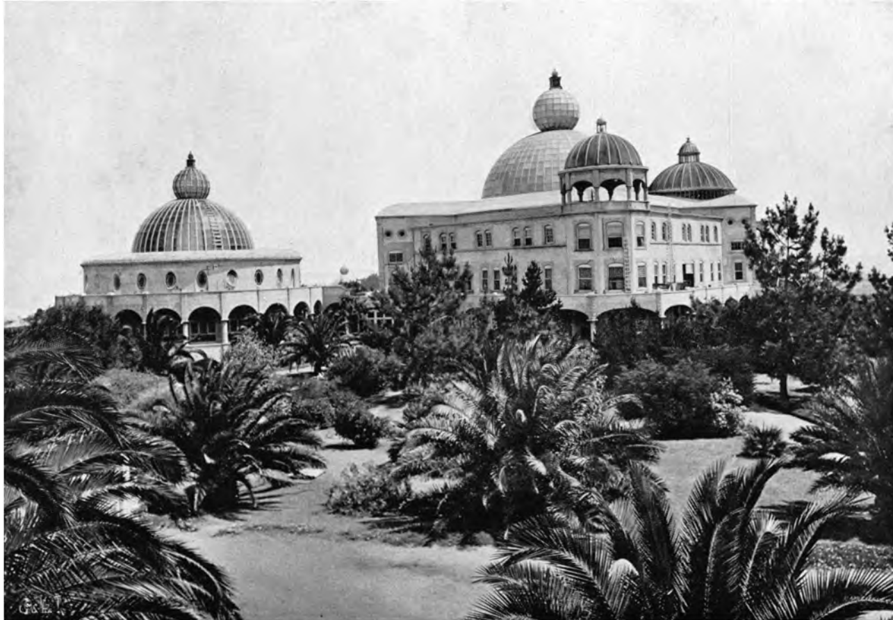
RAJA YOGA-HOCHSCHULE UND ARISCHER TEMPEL INTERNATIONALES THEOSOPHISCHES HAUPTQUARTIER, POINT LOMA, CALIFORNIEN