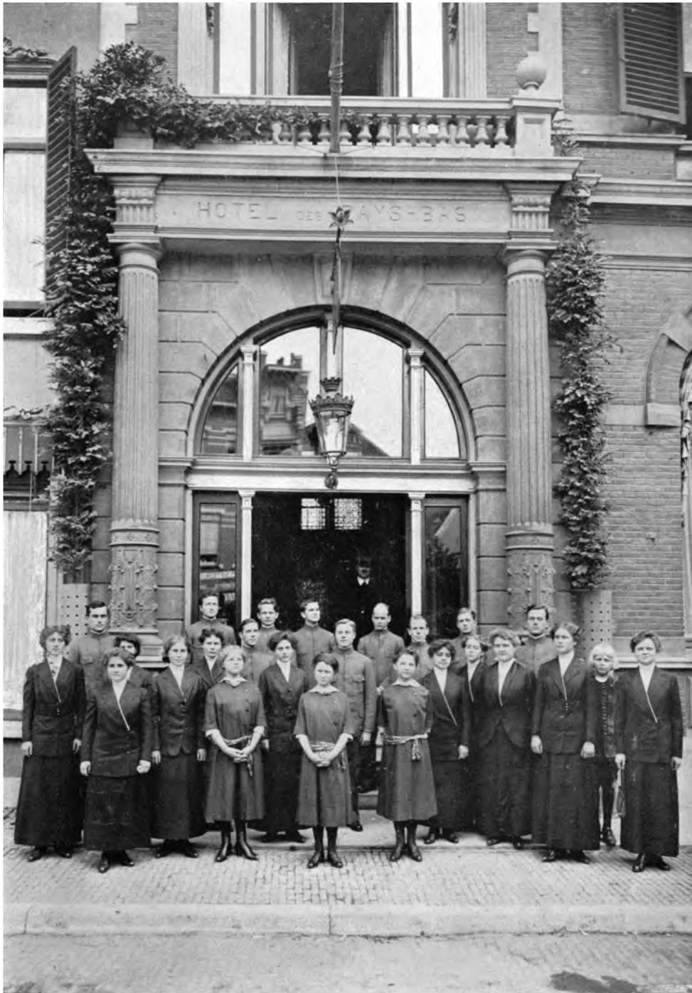
BESUCH DER RAJA YOGAS AUS POINT LOMA IN HOLLAND Die Studenten vor dem Hotel des Pays-Bas in Arnhem