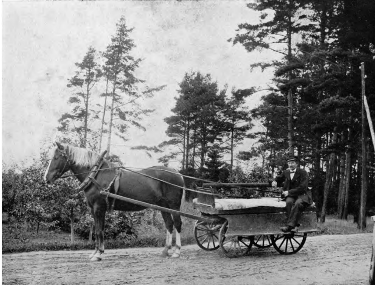
»REMMALAG«, DAS CHARAKTERISTISCHE FAHRZEUG AUF VISINGSÖ, SCHWEDEN