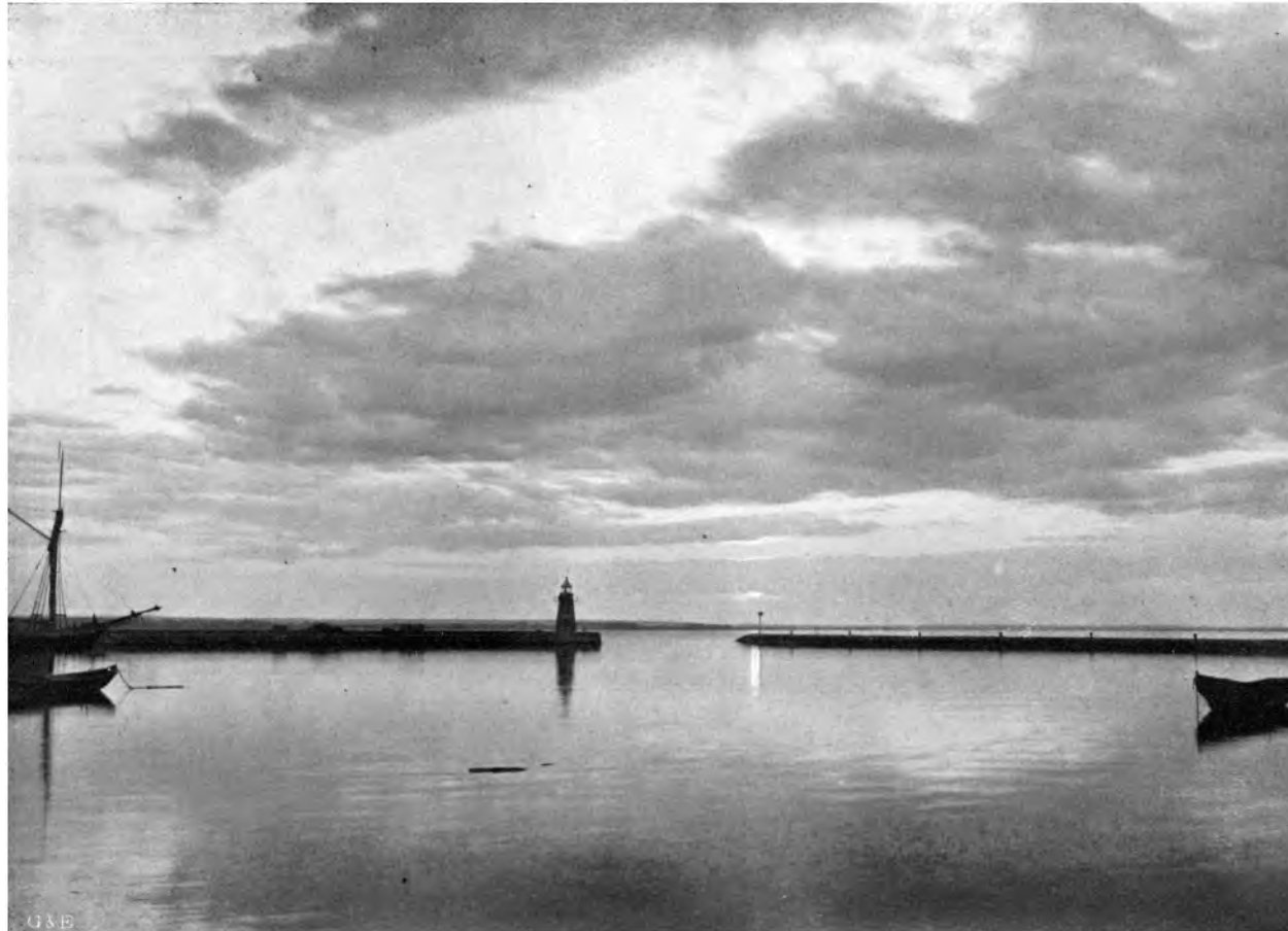
DER HAFEN VON GRENNÄ AM WETTERNSEE, SCHWEDEN