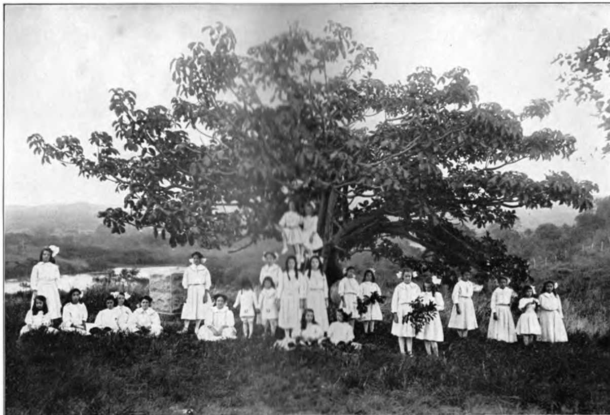
GRUPPE VON RAJA YOGA-KINDERN AM GRUNDSTEIN DES KUBANISCHEN INTERNATIONALEN HAUPTQUARTIERS UND DER RAJA YOGA-AKADEMIE AM SAN JUAN HÜGEL, KUBA