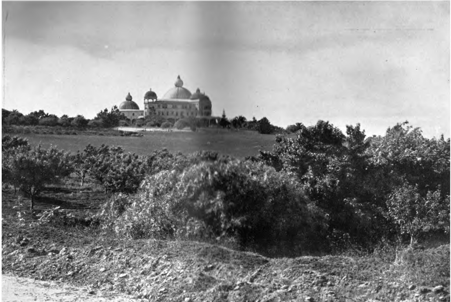
EIN BLICK AUF DIE RAJA YOGA-AKADEMIE INTERNATIONALES THEOSOPHISCHES HAUPTQUARTIER, POINT LOMA, CALIFORNIEN