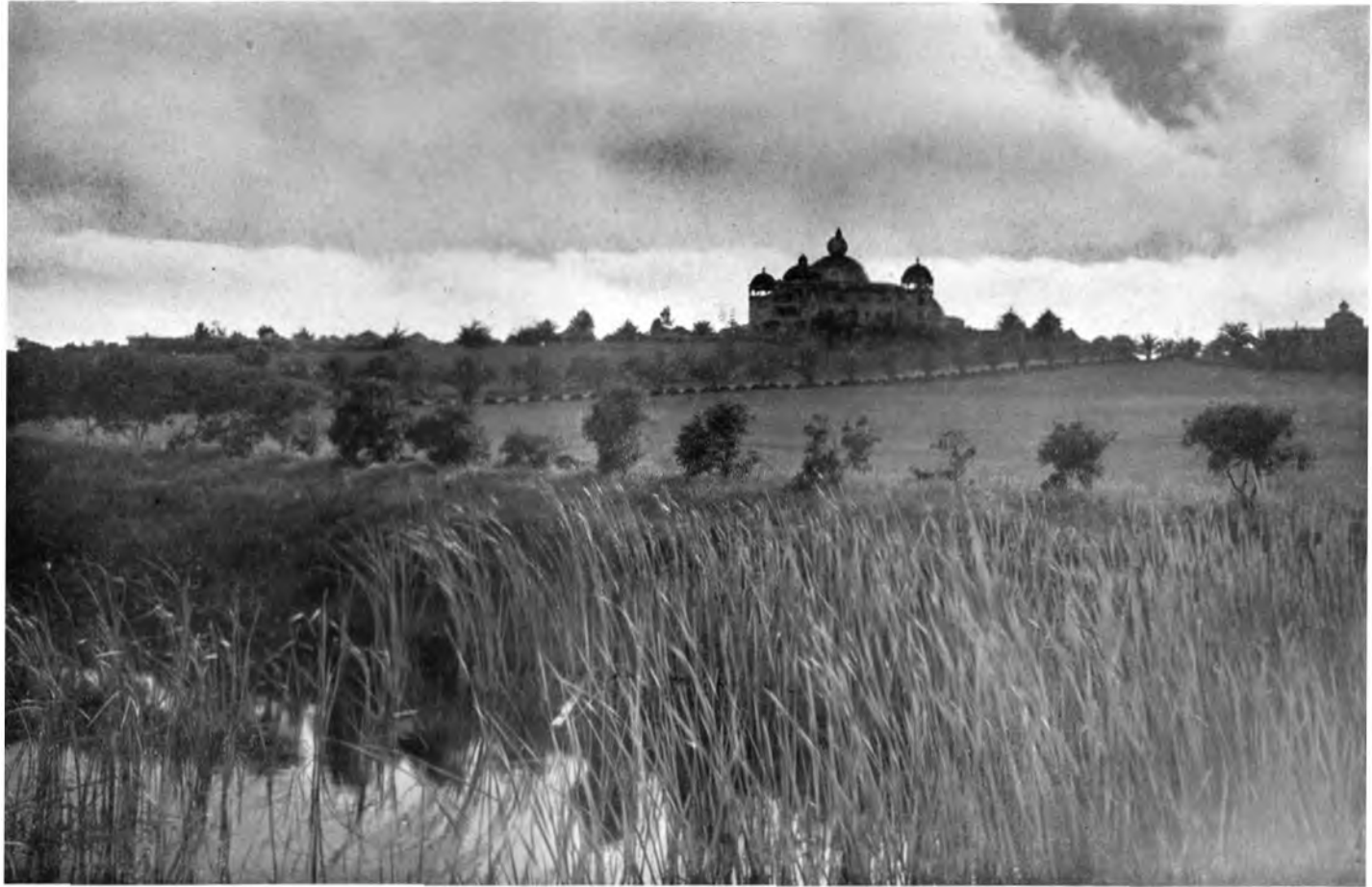
ABENDSTIMMUNG AUF LOMALAND; IM HINTERGRUND DIE RAJA YOGA-HOCHSCHULE ZU POINT LOMA