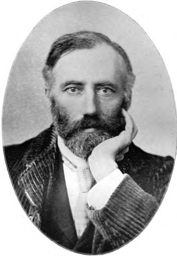
WILLIAM Q. JUDGE