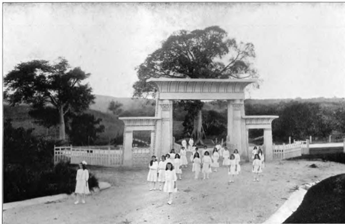
RAJA YOGA-KINDER AM GEDENKTORBÖGEN, DEM EINGANG ZU DEM ZUKÜNFTIGEN KUBANISCHEN INTERNATIONALEN HAUPTQUARTIER, KUBA