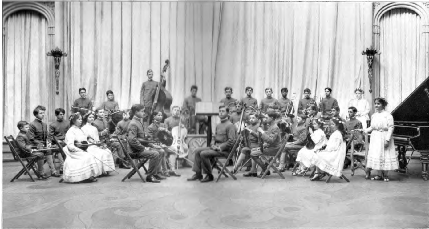
RAJA YOGA-ORCHESTER, GEBILDET AUS ZÖGLINGEN DER RAJA YOGA-AKADEMIE AM INTERNATIONALEN THEOSOPHISCHEN HAUPTQUARTIER, POINT LOMA, CALIFORNIEN