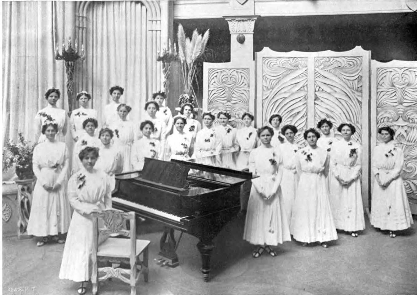
EINE GRUPPE VON RAJA YOGA-SCHÜLERINNEN ZU POINT LOMA