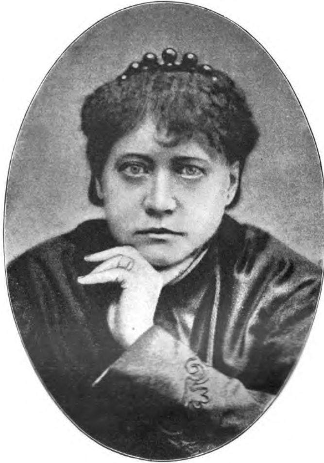
H. P. BLAVATSKY