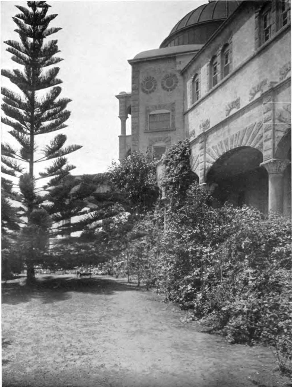
EIN BLICK AUF DIE RAJA YOGA-AKADEMIE ZU POINT LOMA