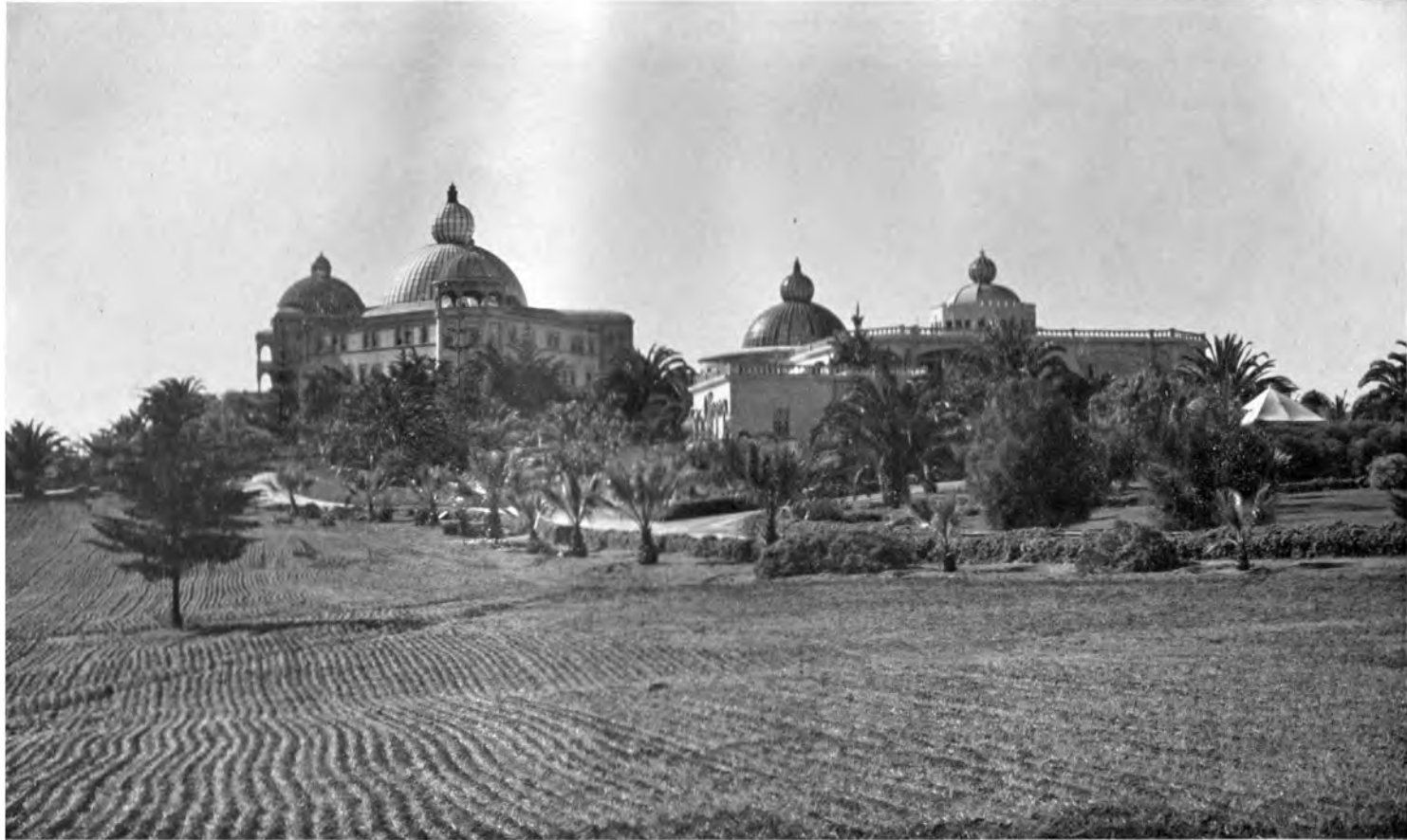
EIN BLICK AUF DEN ARISCHEN ERINNERUNGS-TEMPEL UND AUF DIE RAJA YOGA-HOCHSCHULE INTERNATIONALES THEOSOPHISCHES HAUPTQUARTIER, POINT LOMA, CALIFORNIEN