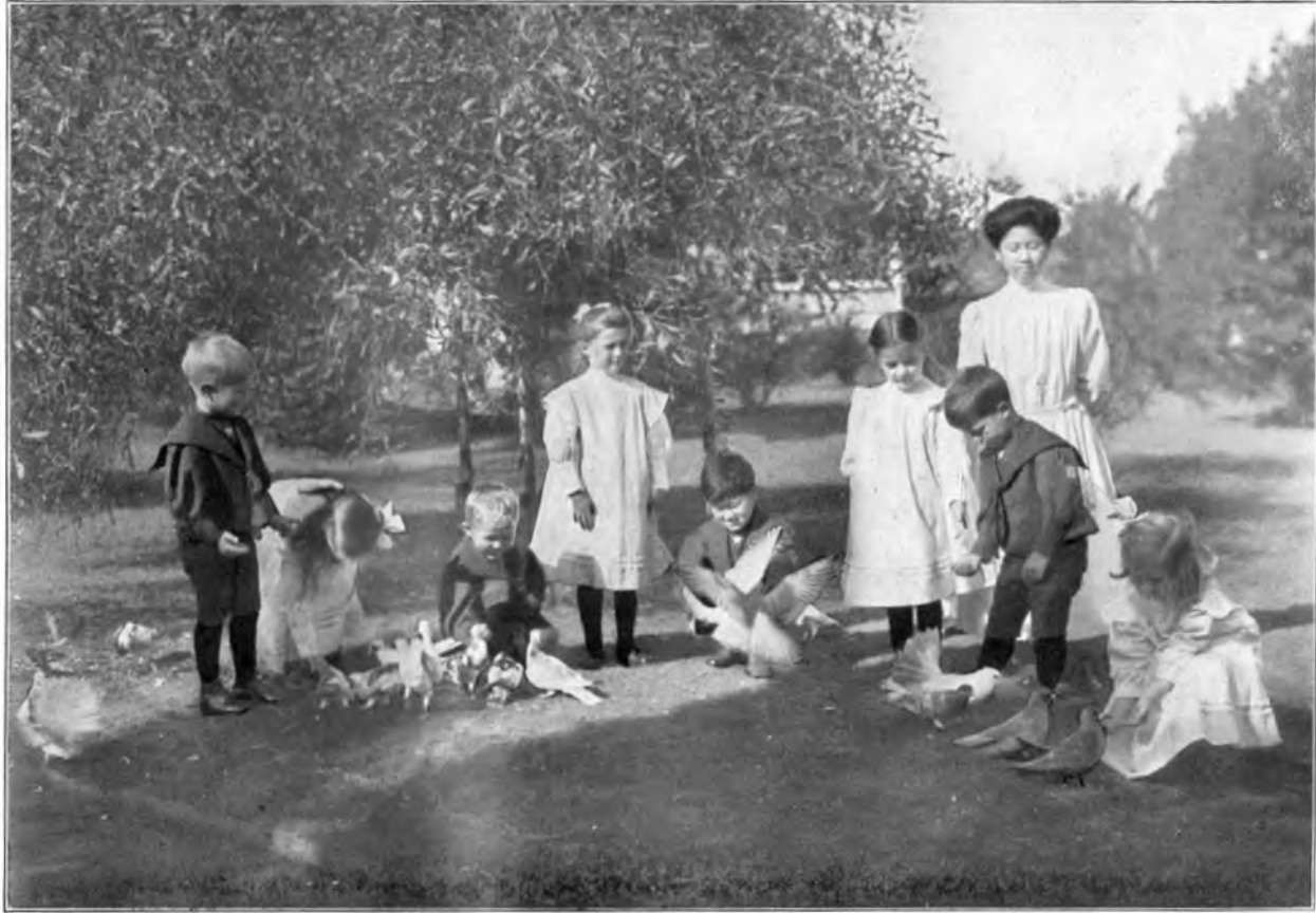
RAJA YOGA-KINDER IN DEN ANLAGEN DES INTERNATIONALEN LOTUS-HEIMS ZU POINT LOMA