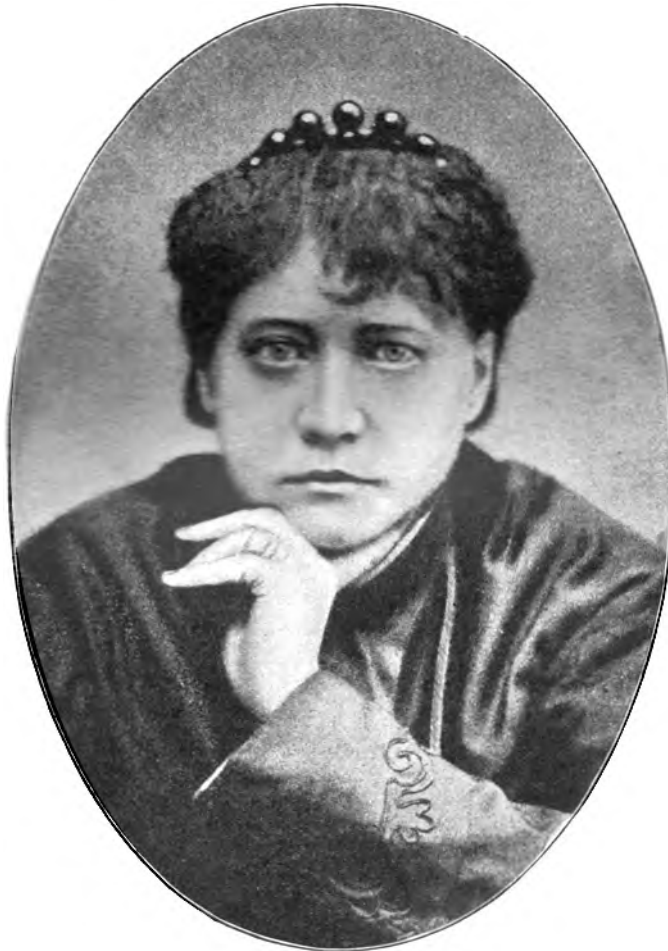
H. P. BLAVATSKY BEGRÜNDERIN DER THEOSOPHISCHEN BEWEGUNG

wird und der neue Bote wieder in der Welt erscheint, er die Gesellschaft noch an der Arbeit, die Ideen weit verbreitet und Ausdrucksformen zur Darstellung und Verkörperung der unwandelbaren Wahrheit vorbereitet finden wird. Auf diese Weise wird die Aufgabe erleichtert worden sein, welche im Jahre 1875 für H. P. Blavatsky so schwierig und von so vielen Hindernissen umgeben war.“