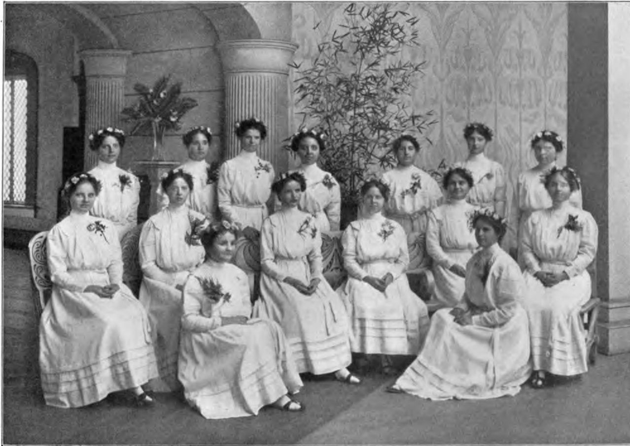
ZÖGLINGE DER RAJA YOGA-HOCHSCHULE AM INTERNATIONALEN HAUPTQUARTIER DER UNIVERSALEN BRUDERSCHAFT UND THEOSOPHISCHEN GESELLSCHAFT ZU POINT LOMA, CALIFORNIEN