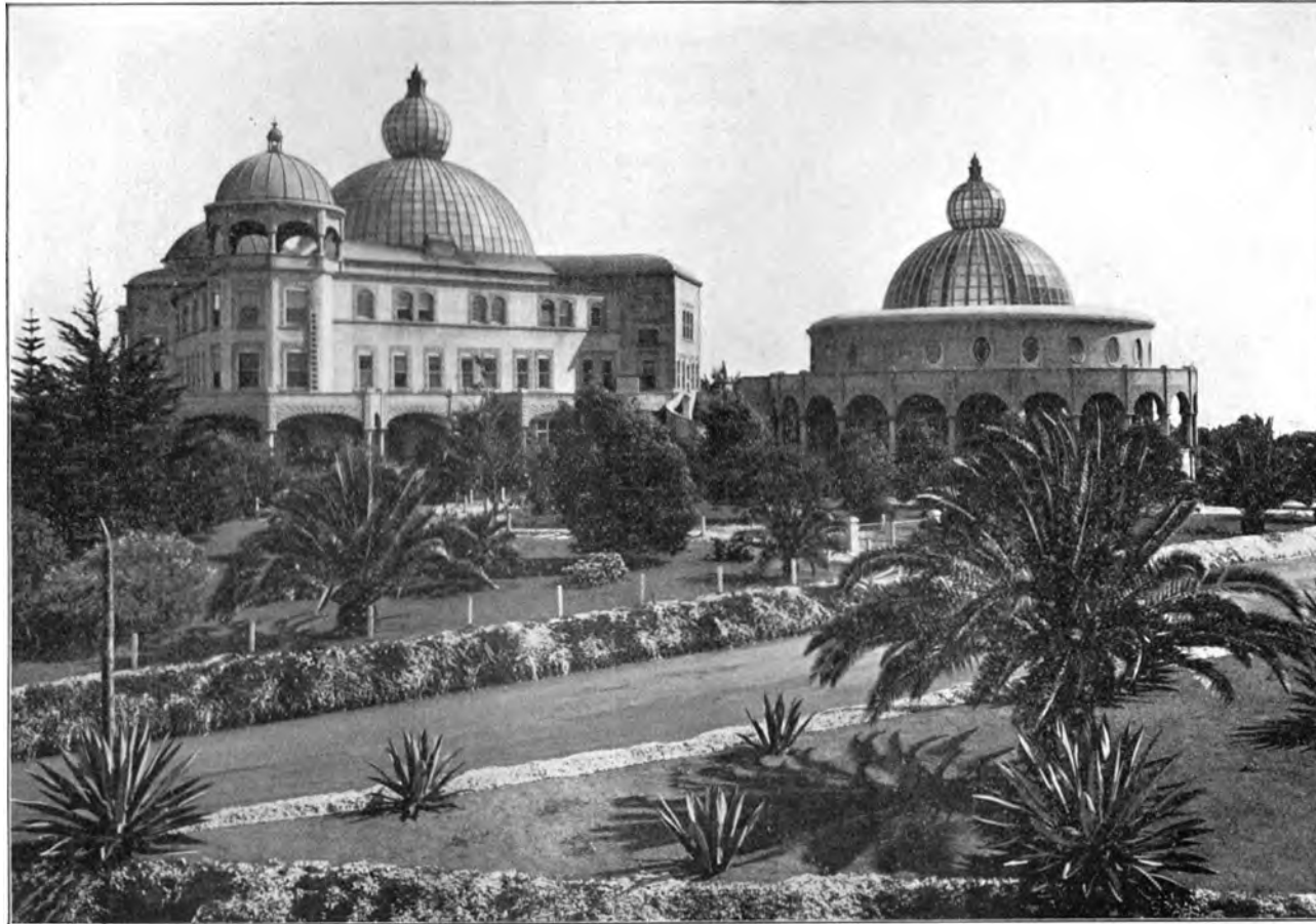
NORD-ANSICHT DER RAJA YOGA-HOCHSCHULE UND DES ARISCHEN GEDENKTEMPELS AM INTERNATIONALEN HAUPTQUARTIER DER UNIVERSALEN BRUDERSCHAFT UND THEOSOPHISCHEN GESELLSCHAFT ZU POINT LOMA, CALIFORNIEN