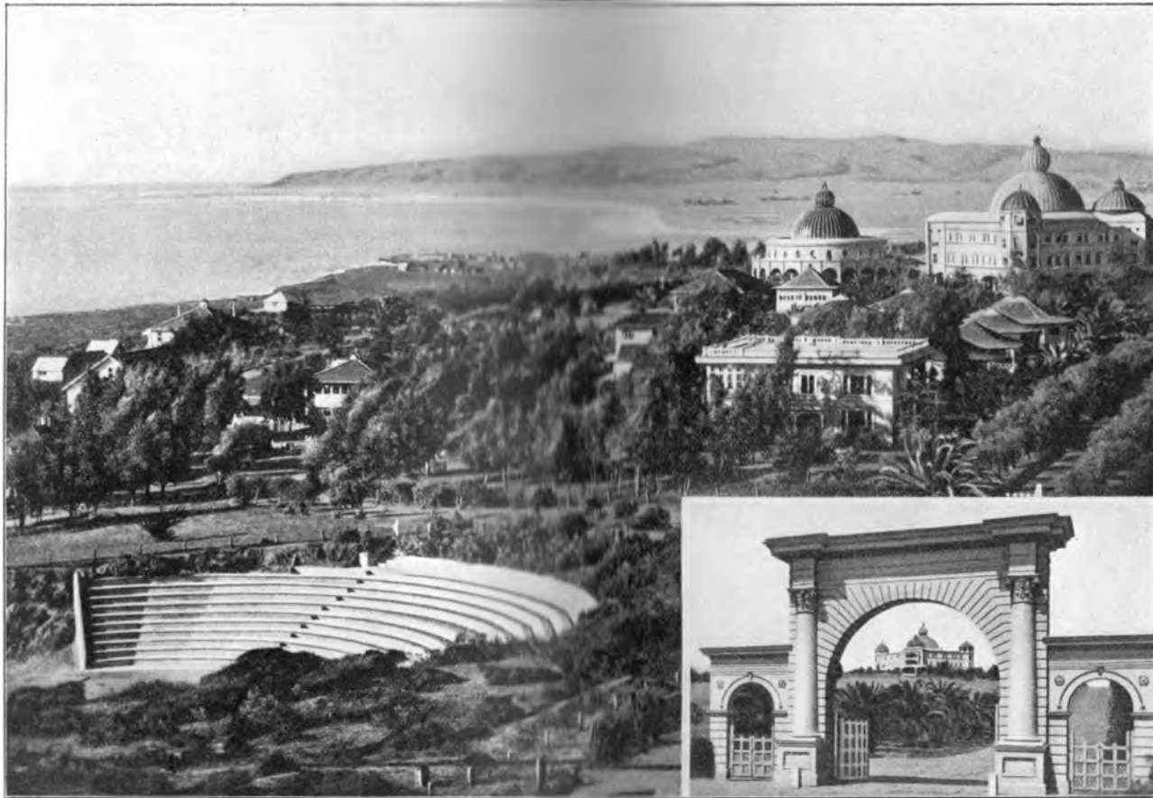
PANORAMA DES INTERNATIONALEN HAUPTQUARTIERS DER UNIVERSALEN BRUDERSCHAFT UND THEOSOPHISCHEN GESELLSCHAFT, POINT LOMA, CALIFORNIEN MIT BLICK AUF DEN ARISCHEN GEDENK-TEMPEL, DIE RAJA YOGA-HOCHSCHULE, DIE RAJA YOGA- KNABEN-HEIME, DAS VERWALTUNGS-GEBÄUDE UND EINEN TEIL DES GRIECHISCHEN THEATERS. NEBST EINER ANSICHT DES HAUPTINGANGES