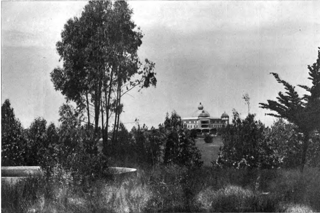
DIE RAJA YOGA-HOCHSCHULE ZU POINT LOMA AUS DER FERNE Internationales Theosophisches Hauptquartier, Point Loma, Californien