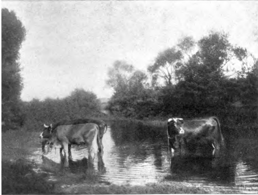
LANDSCHAFTS-STUDIE AUS DEUTSCHEN GAUEN