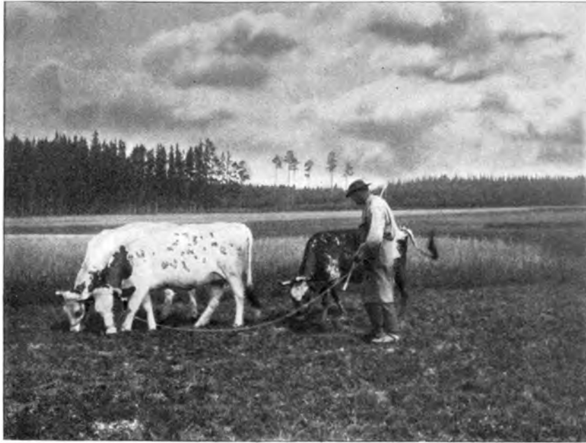
LANDSCHAFTS-STUDIE AUS DEUTSCHEN GAUEN