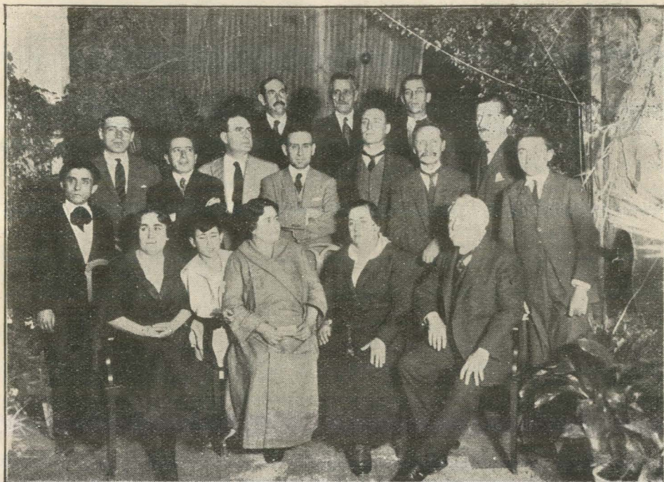
Grupo de M. S. T. de la Lógia "Gautama" de Mendoza reunidos el 17 de Noviembre, Aniversario de la fundación de la Sociedad.