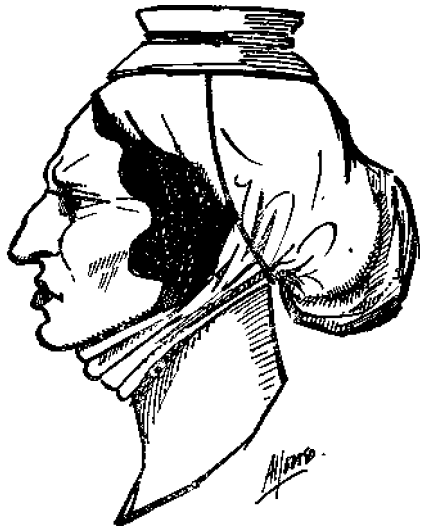
, CAMPESINA DE TENERIFE

y las estrellas (en Tenerife se jura por la luz del astro del día. Sus danzas eran acompañadas de música triste. Ponían los muertos con la cabeza al Norte (cosa que coincide con ciertas costumbres japonesas), y no conocían los licores fermentados, bebiendo solo agua pura. Tenían su Trinidad religiosa: Achahueran , Dios creador; Achguayaxirax , Dios conservador, y Achaman . Eran galantes según nos dicen los historiadores. Todos estos detalles nos vienen a confirmar que no era un pueblo primitivo,