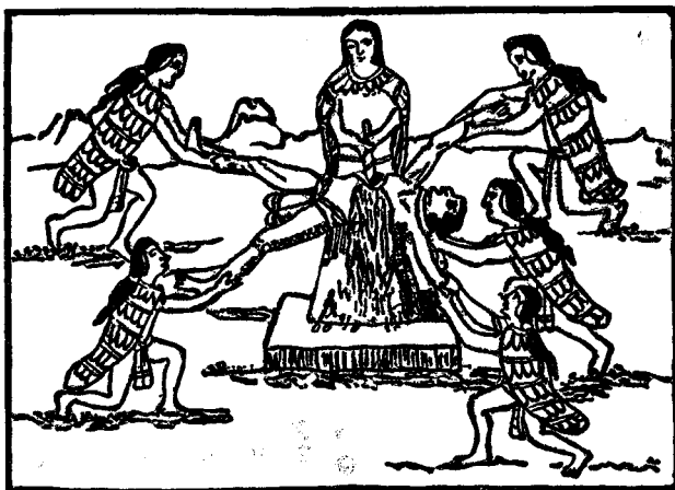
ESCENA DEL SACRIFICIO

Tuvo que vencer numerosos enemigos, como el sol que debe disipar las muchas nubes y vapores que velan su luz antes de alumbrar la tierra, después de haber nacido de una mujer que representa á la aurora.