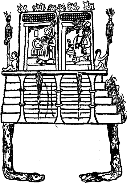
EL GRAN TEMPLO DE MÉJICO (según el P. Durán).

nos del siglo XVI, la sola vista de las dos divinidades casi monstruosas que ocupaban la capilla del vértice de la pirámide; el altar de los sacrificios, rojo de sangre humana; los corazones de