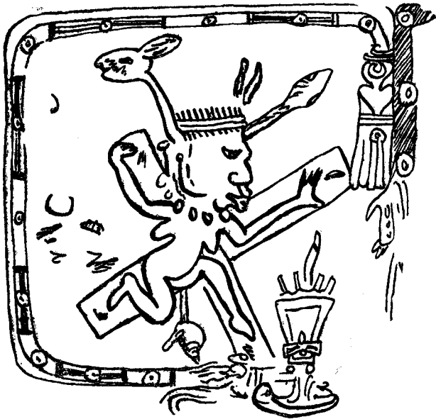
Fig. 3.*—Codex Vaticanus.

Las fiestas de Quetzalcoatl eran precedidas de un ayuno de