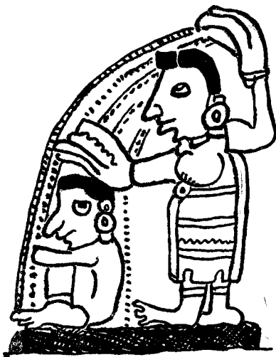
Fig. 1.º—Codex Troano.

La confesión estaba muy en uso entre los mejicanos; la practicaban, aunque no era obligatoria. Los que pedían confesarse con un sacerdote eran, generalmente, los viejos y los moribundos; el sacerdote, antes de escucharles, les hacía, á modo de juramento, tocar la tierra y besar el suelo. Una vez terminada la confesión de las faltas, les imponía una penitencia y les daba la absolución, que tenía por objeto redimir espiritualmente los