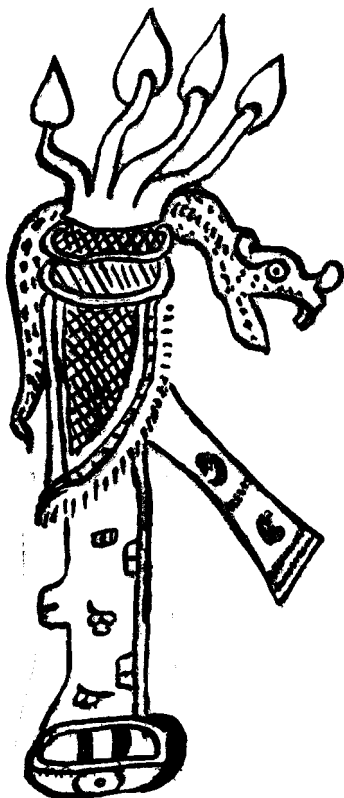
Fig. 2.ª—Codex Dresdenensis.

Una de estas maceraciones, que consistía en sacarse sangre de las orejas con una espina, es el sujeto de una de las ilustraciones del Codex Troano (1). Siempre esta imagen representa cuatro personajes en el acto de cumplir esta dolorosa operación. La sangre corre de la herida y va á caer en vasos colocados al pie de los pacientes, sin duda para ofrecerla al Dios como un sacrificio.