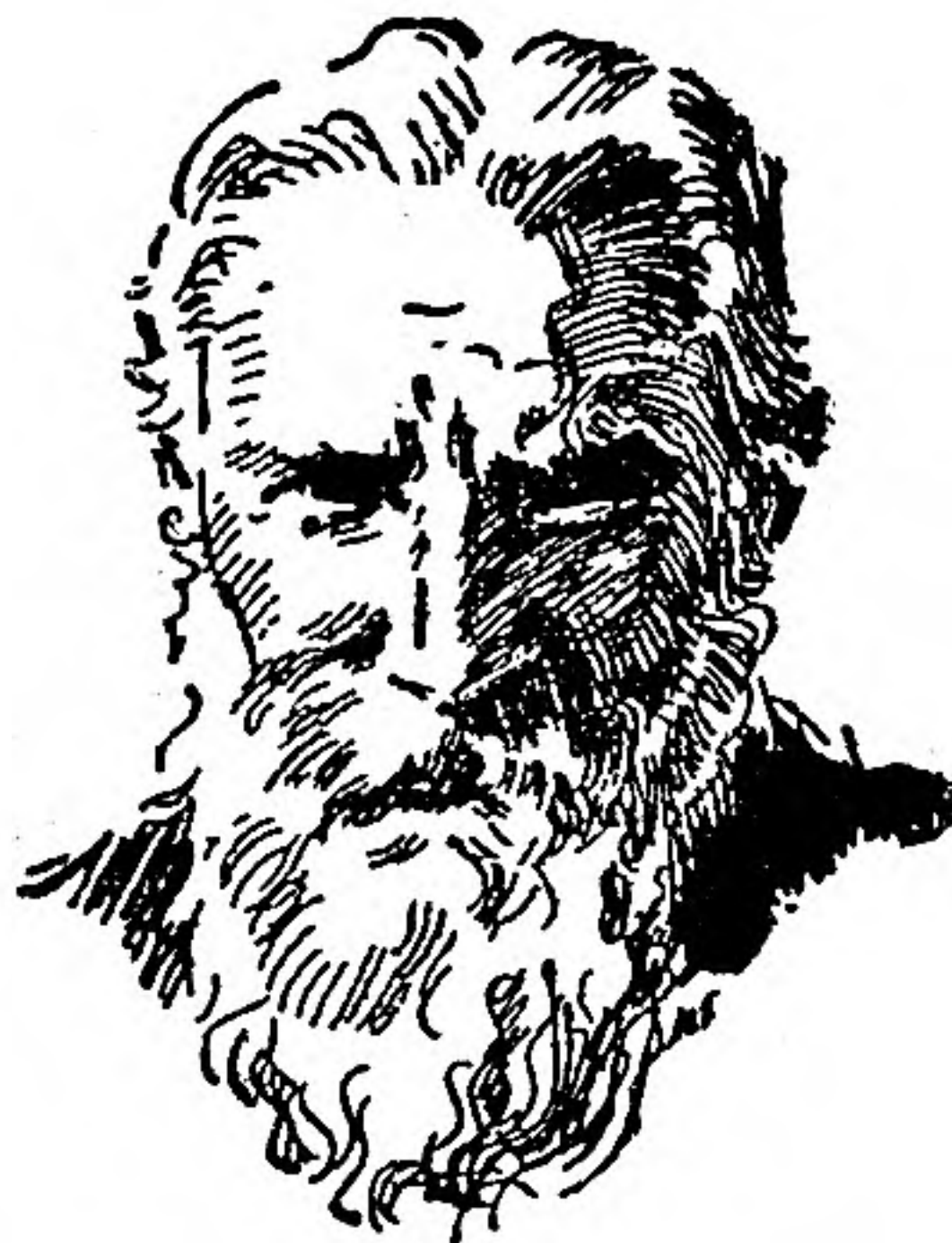
C. W. LEADBEATER