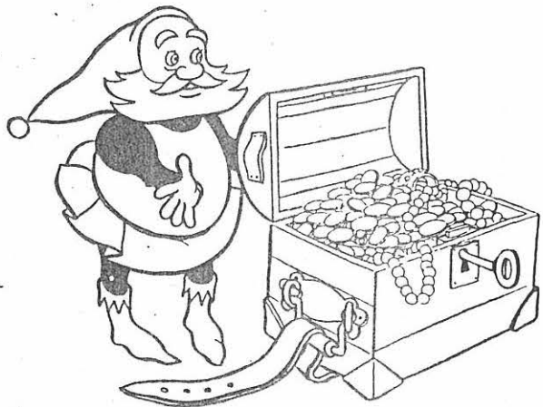
Quantas riquezas contidas em um só livro!!!

Levando-o então diante de uma caverna em que faiscavam o ouro e as pedrarias, disse-lhe. «Eis aí uma