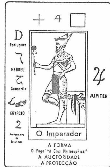
Lamina a que se refere o texto.

Se meditarmos no que representa uma esfera com seus três diâmetros (as três dimensões físicas), e os três círculos máximos, correspondentes a esses diâmetros (as três dimensões superiores), encontraremos o GLOBO simbólico da figura 2 «como signo de domínio, govêrno, etc., usado pelos reis, Imperadores, o próprio Papa. No arcano IV, do Taro (letra hebraica, DALETH ), que é o Imperador ou JUPITER (Jove, Jeove ou Jehovah...) — de que é sua expressão máxima, o REI ou IMPERADOR DO MUNDO (Reino, pois, da AGHARTA... ), é visto o mesmo símbolo. A imagem do Salvador do Mundo trás o mesmo símbolo (o globo terrestre), na destra.