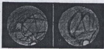
FIGURES 1 et 2

Quoi qu'il en soit nous trouvons en eux des manifestations d'une vie différente de la nôtre et, sans doute, à une organisation hydrologique formidable que nous ne pouvons imaginer. Nous donnons ci-après deux dessins de la planète d'après l'aspect télescopique de Mars et l'on y voit les canaux qui y sont très apparents (voir Fig. 1 et 2).