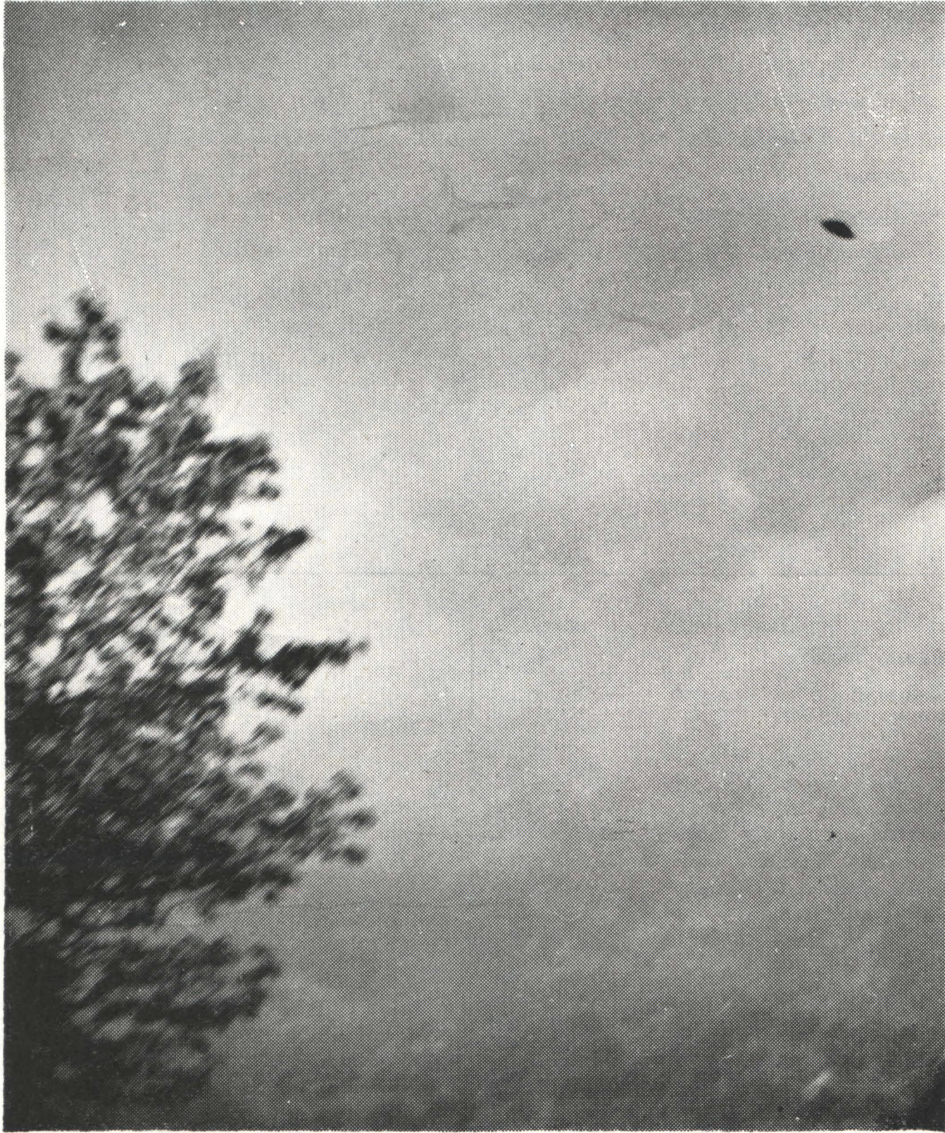
Disco volante fotografato a Piano Audi alle ore 11,45 del 29 agosto 1962

THE INTERNATIONAL FLYING SAUCER NEWS - PUBLISHED BY GIANNI SETTIMO - CASELLA POSTALE 604 - TORINO CENTRO (ITALY)