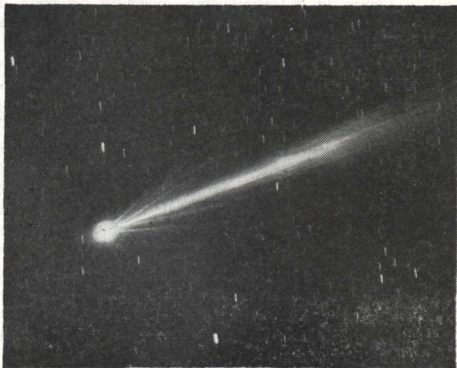
ATTENTI: NON E' UN U.F.O.

L'apparenza di moto può essere dato anche da stelle particolarmente luminose quali Vega, Arturo, Sirio ecc. quando appaiono e scompaiono fra le nuvole. E' facile, uscendo ad esempio da un cinema vedere in cielo il moto apparente di un oggetto luminoso subito eclissato da una coltre di nubi. Non potendosi avere in tal caso una stima successiva, può rimanere sempre il sospetto di aver visto « qualcosa » di strano... la fantasia, innata nell'uomo, fa il resto.